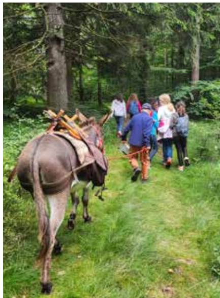
© Les Ânes des Monts d'Ardèche

Ânes des Monts d'Ardèche - 06 25 39 38 24